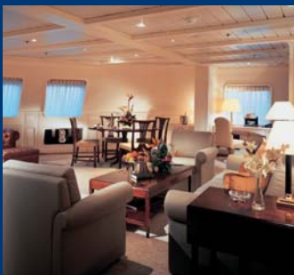
GRAND SUITE – SILVER WHISPER