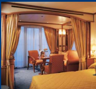
VERANDA SUITE – SILVER SHADOW | SILVER WHISPER